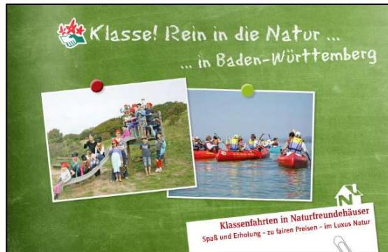
Klassenfahrten Baden Württemberg