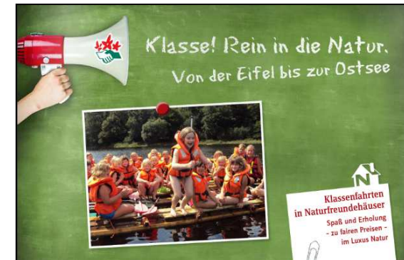
Klassenfahrten Eifel – Ostsee