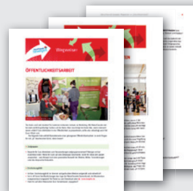
WEGWEISER ZU THEMEN DER VEREINSARBEIT DIN A4