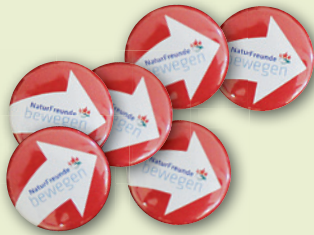
„NATURFREUNDE BEWEGEN“-BUTTONS Durchmesser 25 mm

→ Jetzt mit dem Anmeldeformular auf der Vorderseite kostenlos bestellen!