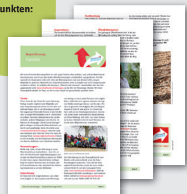
PLANUNGSHILFEN FÜR AKTIONSTAGE DIN A4