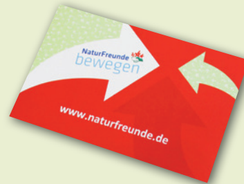
„NATURFREUNDE BEWEGEN“-AUFKLEBER 85 x 55 mm