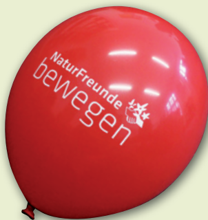
„NATURFREUNDE BEWEGEN“-LUFTBALLONS Natur-Latex, Höhe ca. 30 cm