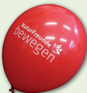
„NATURFREUNDE BEWEGEN“-LUFTBALLONS Natur-Latex, Höhe ca. 30 cm