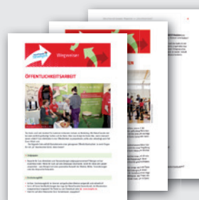
WEGWEISER ZU THEMEN DER VEREINSARBEIT DIN A4