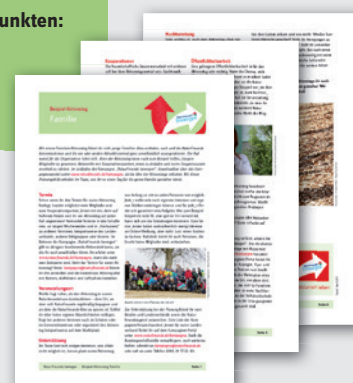
PLANUNGSHILFEN FÜR AKTIONSTAGE DIN A4