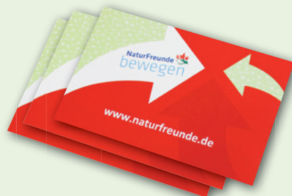
„NATURFREUNDE BEWEGEN“-AUFKLEBER 85 x 55 mm