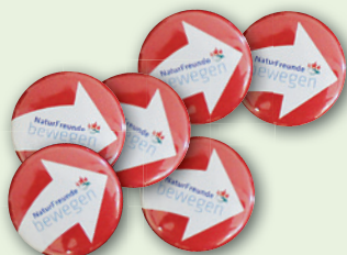
„NATURFREUNDE BEWEGEN“-BUTTONS Durchmesser 25 mm

→ Jetzt mit dem Anmeldeformular auf der Vorderseite kostenlos bestellen!